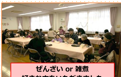
ぜんざい or 雑煮 好きな方をいただきました