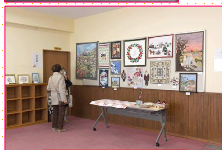
パッチワーククラブ