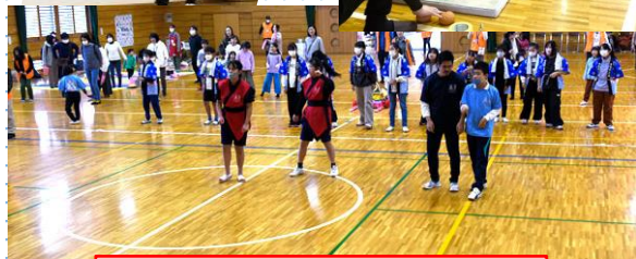
(神戸西神南スポーツクラブ Vivo)