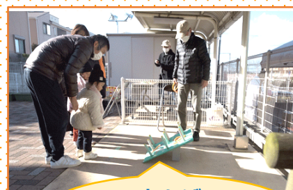
わなげ 上手くはいるカナ?