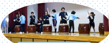
いぶき和太鼓クラブ