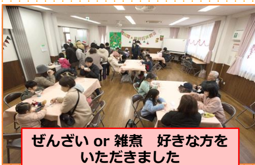
ぜんざい or 雑煮 好きな方を いただきました