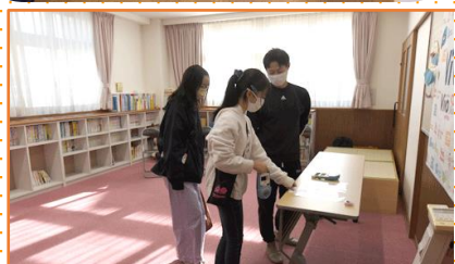
体組成測定 神戸西神南スポーツクラブ Vivo