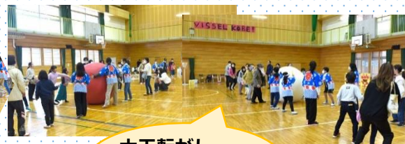
大玉転がし 「赤も白も頑張れ!」